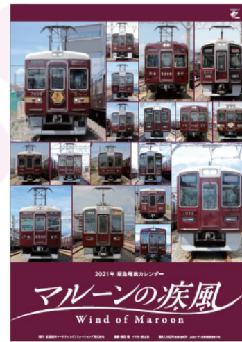
阪急電鉄カレンダー