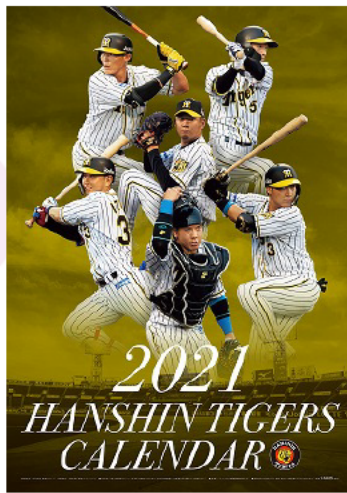
阪神タイガースカレンダー◎阪神タイガース