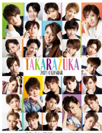
宝塚卓上カレンダー◎宝塚歌劇団