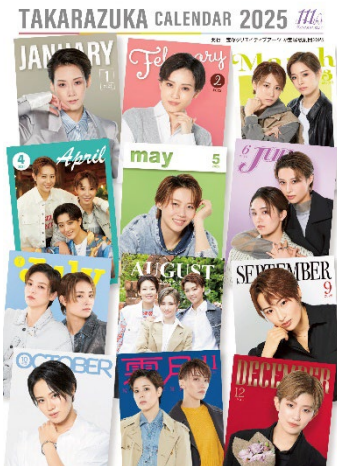
宝塚卓上カレンダー