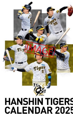
阪神タイガースカレンダー