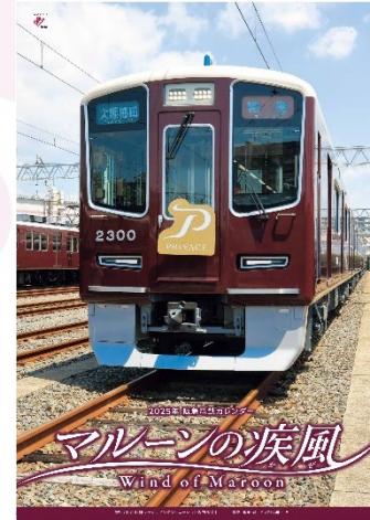
阪急電鉄カレンダー