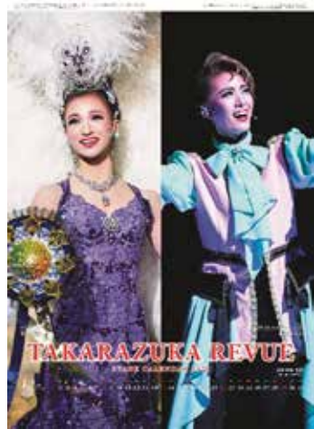
宝塚ステージカレンダー