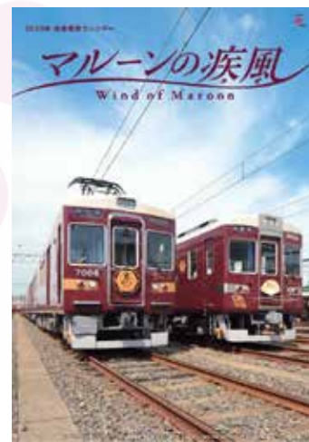
阪急電鉄カレンダー