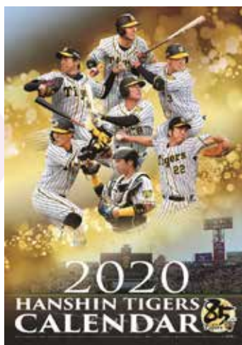
阪神タイガースカレンダー©阪神タイガース