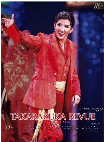
宝塚ステージカレンダー