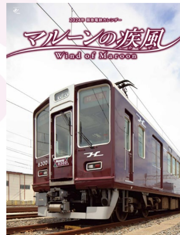
阪急電鉄カレンダー