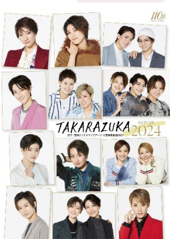
宝塚卓上カレンダー