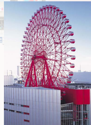
宝塚ステージカレンダー©宝塚歌劇団 宝塚卓上カレンダー©宝塚歌劇団 阪神タイガースカレンダー©阪神タイガース 阪急電鉄カレンダー HEP FIVE 観覧車

（※ 写真は2018年版です。お送りするカレンダーは2019年版で、写真とは異なります。また、宝塚卓上カレンダーはA5版となります。）