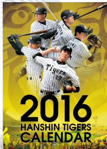
阪神タイガースカレンダー