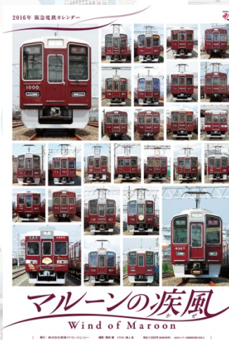
阪急電鉄カレンダー