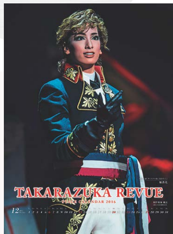
宝塚ステージカレンダー