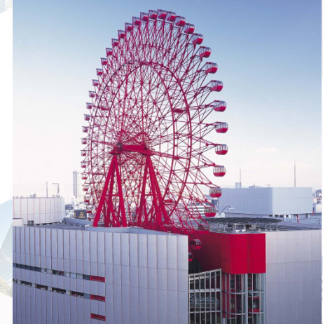
HEP FIVE 観覧車

(※ 写真は2015年版です。お送りするカレンダーは2016年版で、写真とは異なります。)