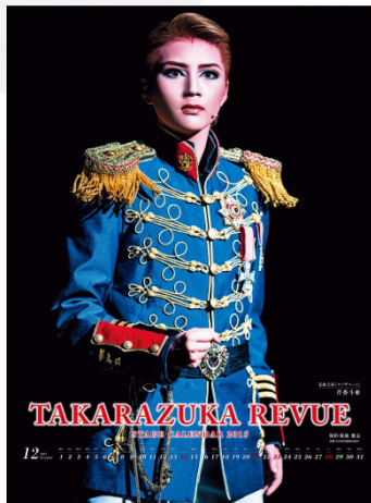
宝塚ステージカレンダー

※平成26年12月1日を効力発生日として、投資口の5分割を実施しており、現時点で投資主総数を把握できていないことから、各カレンダー及びHEP FIVEの観覧車ペア搭乗券の当選数に関しましては、アンケート発送時にお知らせをいたします。