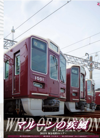
阪急電鉄カレンダー