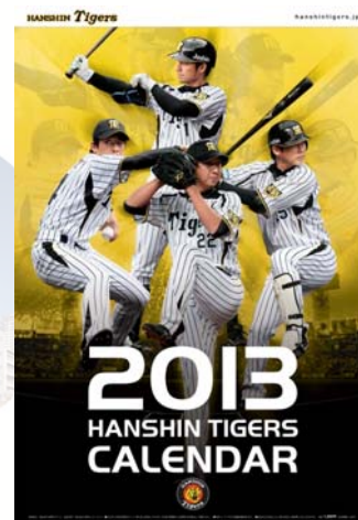
阪神タイガースカレンダー