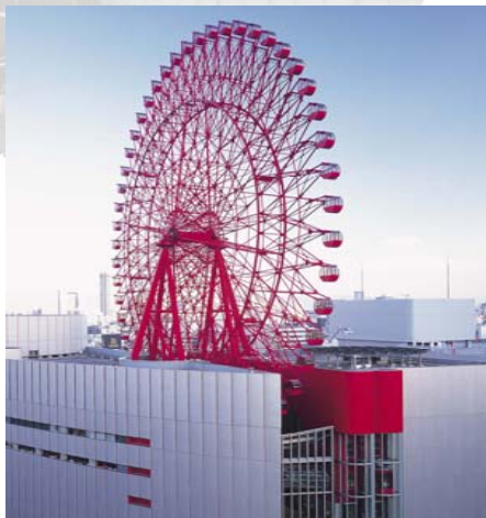
HEP FIVE 観覧車

（回答方法）平成25年5月期（第16期）の資産運用報告へアンケートハガキを同封いたしますので、ご回答の上ご返送下さい。 （なお、平成25年5月期（第16期）の資産運用報告は8月中旬頃発送予定です。）