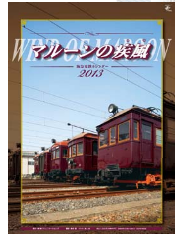
阪急電鉄カレンダー

（※ 写真は2013年版です。お送りするカレンダーは2014年版で、写真とは異なります。）