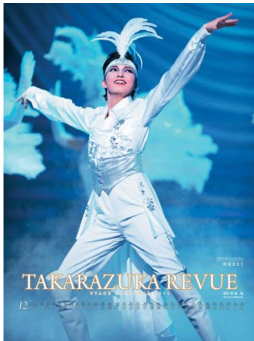
宝塚ステージカレンダー（90名）

（回答方法）平成23年5月期（第12期）の資産運用報告へアンケートハガキを同封しますので、ご回答の上ご返送ください。 （なお、平成23年5月期（第12期）の資産運用報告は8月中旬頃発送予定です。）