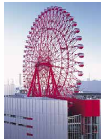
宝塚ステージカレンダー©宝塚歌劇団 宝塚卓上カレンダー©宝塚歌劇団 阪神タイガースカレンダー©阪神タイガース 阪急電鉄カレンダー HEP FIVE 観覧車

（写真は2019年版です。お送りするカレンダーは2020年版で、写真とは異なります。また、宝塚卓上カレンダーはA5版となります。）